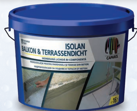
Pentru balcoane și terase