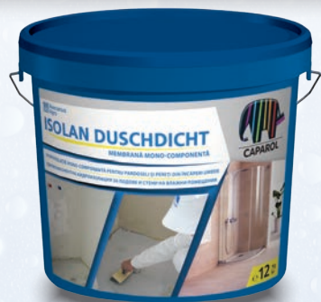
Pentru băi și spații umede