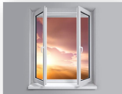
Aerisirea corectă a încăperilor