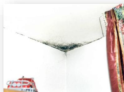
Mucegaiul pe pereții interiori

În cazul în care pereții sunt afectați de mucegai, Caparol vă propune următoarea soluție de tratare a acestor suprafețe și de eliminare permanentă a mucegaiului din locuința dumneavoastră: